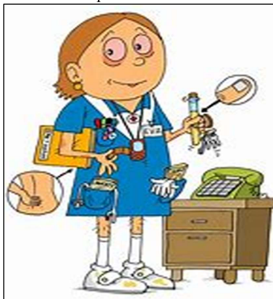
Obrázek 1 Popisek obrázku